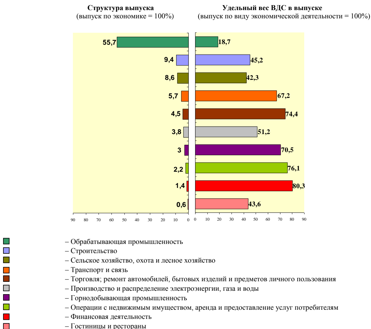
Рисунок 2 – Структура выпуска и удельный вес ВДС в выпуске по основным видам экономической деятельности в 2013 году, %

Сфера производства в общем объеме выпуска товаров и услуг занимает 80,5%, в том числе обрабатывающая промышленность – 55,7%. Вместе с тем за счет высокой материалоемкости обрабатывающей промышленности удельный вес ВДС составляет 18,7% в общем объеме выпуска (рисунок 2).