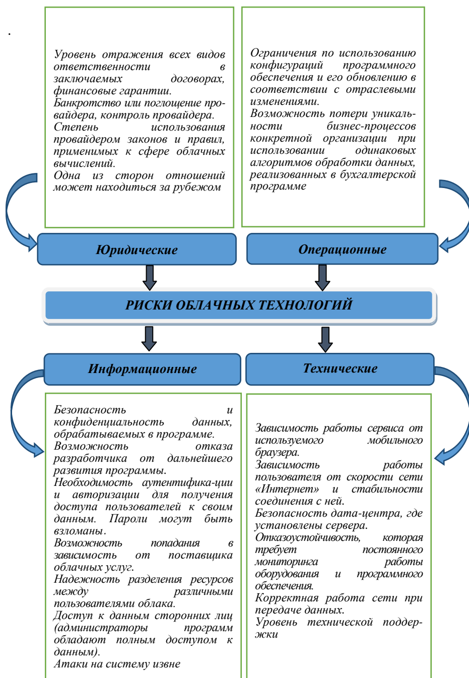
Рисунок 2 – Виды рисков использования облачных технологий в бухгалтерском учете

Виды рисков и направления их минимизации зависят от видов облачных сервисов (IaaS, PaaS, SaaS) и форм использования облачных технологий (частное, публичное или комбинированное облако). Если частное облако находится в собственности организации и физически существует внутри ее юрисдикции, то возможно абстрагироваться от идеи облака и полагать, что организация его не использует. При использовании частного облака можно считать клиентами работников организации, а ее саму – провайдером услуг. Данная форма использования облачных сервисов в основном применяется крупными организациями.