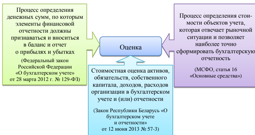
Рисунок 1 – Понятие категории «оценка»

В Инструкции по бухгалтерскому учету основных средств, утвержденной постановлением Министерства финансов Республики Беларусь от 30 апреля 2012 г. № 26, даны следующие виды стоимостных оценок: