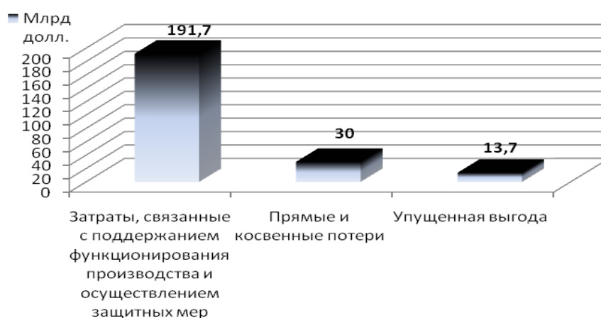
Рисунок 1 – Структура общего ущерба Республики Беларусь за 1986–2015 гг. от последствий катастрофы на Чернобыльской АЭС, млрд долл. США

Структура общего ущерба отражена на рисунке 1.