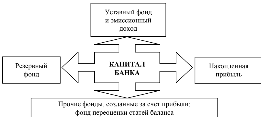
Рисунок Г.1 – Состав капитала банка