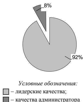
Рисунок 2 – Диаграмма структуры степени развития административных и лидерских способностей студентов в 2010 г., %

Тест «Степень развития администраторских или лидерских способностей» позволяет выявить, какой тип лидерства (формальный или неформальный) преобладает у студента. По результатам исследования (рисунок 2) у основной массы студентов (91,7%) преобладают лидерские качества, и только у 8,3% – административные, что, скорее всего, объясняется отсутствием навыков руководящей работы.