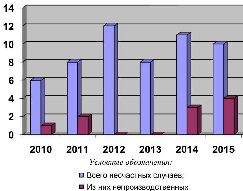
Рисунок 3 – Динамика несчастных случаев с тяжелым исходом за 2010–2015 годы в организациях потребительской кооперации

Проанализировав ситуацию с производственным травматизмом в системе Белкоопсоюза за 2010–2015 годы, необходимо отметить тенденцию к его снижению по показателям общего и смертельного травматизма.