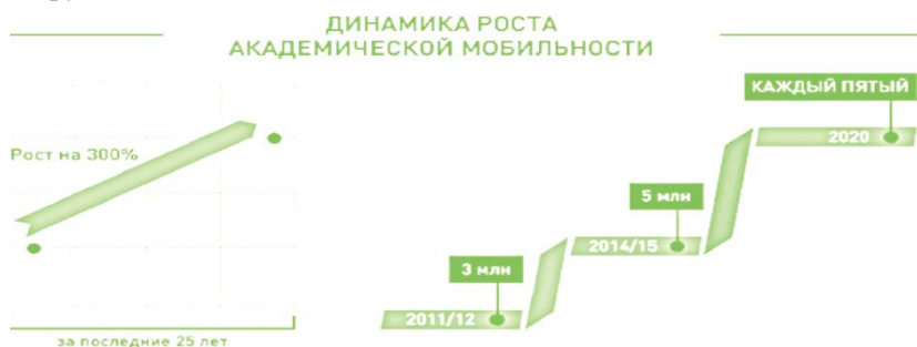
Рис. 1. Предполагаемая динамика академической мобильности

ло целевые показатели наращивания академической мобильности к 2020 г. (так называемый «критерий 20-20-20»): не менее 20 % выпускников вузов ЕПВО должны пройти обучение или практику за рубежом [1].