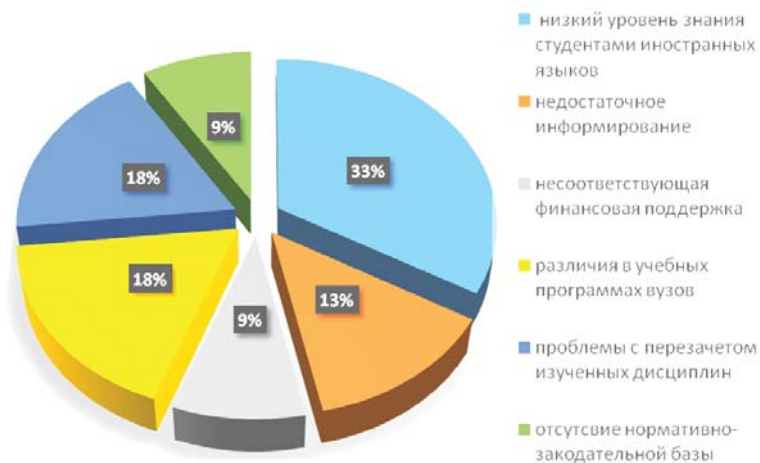
Рис. 5. Результаты обсуждения проблемы студенческой мобильности на виртуальном исследовательском центре проекта La MANCHE

2. Различия в содержании программ белорусских и европейских университетов.