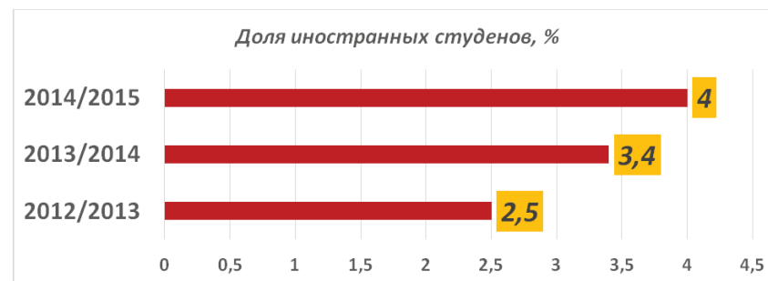
Рис. 3. Динамика экспорта образовательных услуг

На начало 2013/2014 учебного года в 54 вузах Беларуси обучалось 13,9 тыс. граждан иностранных государств (3,4 % от общего количества студентов и магистрантов), в текущем 2014/2015 учебном году высшее образование получают 4 % всех студентов. Динамика экспорта образовательных услуг представлена на рис. 3.