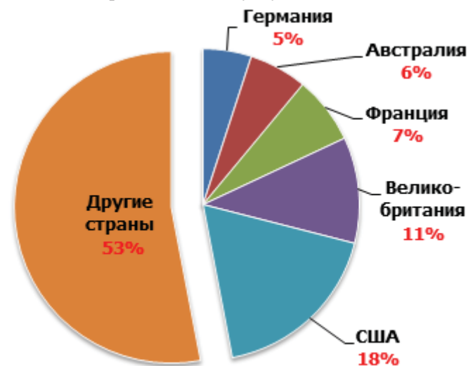
Рис. 4. Международная студенческая мобильность по данным Института статистики ЮНЕСКО

шой привлекательности для студентов со всего мира. В настоящее время академическая мобильность рассматривается как средство повышения конкурентоспособности европейского высшего образования. Связь между уровнем академической мобильности и качеством образования прямая: страны с высоким качеством образования привлекают студентов. В свою очередь, высокий уровень мобильности увеличивает конкуренцию и повышает спрос на высокое качество образовательных услуг.