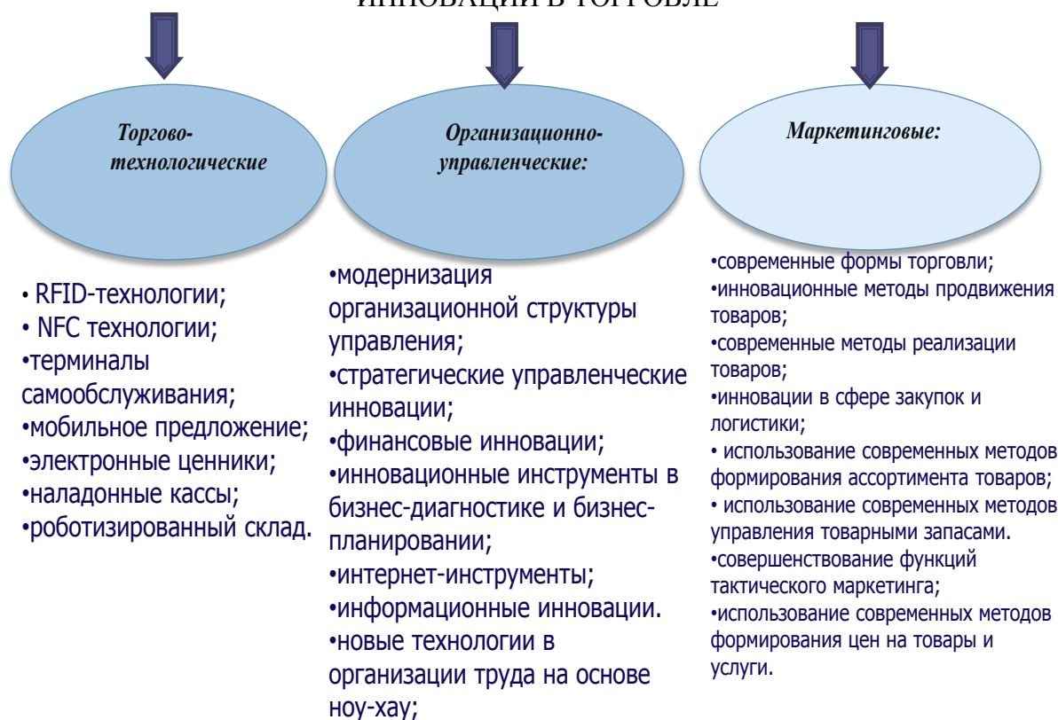
Рисунок 1 – Инновации в торговле

По нашему мнению, осуществление инноваций в кооперативной торговле приведет к следующим результатам: