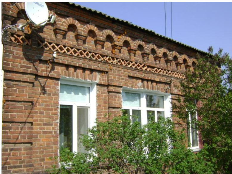
Малюнак 7 – Дом № 41 на вул. М. Горкага ў 2014 г.

расколіна. Аднак за семдзесят гадоў яна не павялічылася і паступова была затынкавана, затое ёсць сямейная легенда і таксама дадатковая нагода падзвіцца майстэрству колішніх муляроў, збудаваўшых такі трывалы будынак [1].