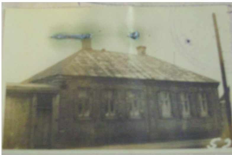
Малюнак 2 – Гэты ж дом у 1949 г.

На жаль, з кожным днём штосці страчваецца з элементаў канструкцыі і дэжора дома. Так, на леташнім фотаздымку (гл. малюнак 1) можна ўбачыць захаваўшыся арыгінальныя складныя аканіцы, а сёлета яны ўжо зніклі.