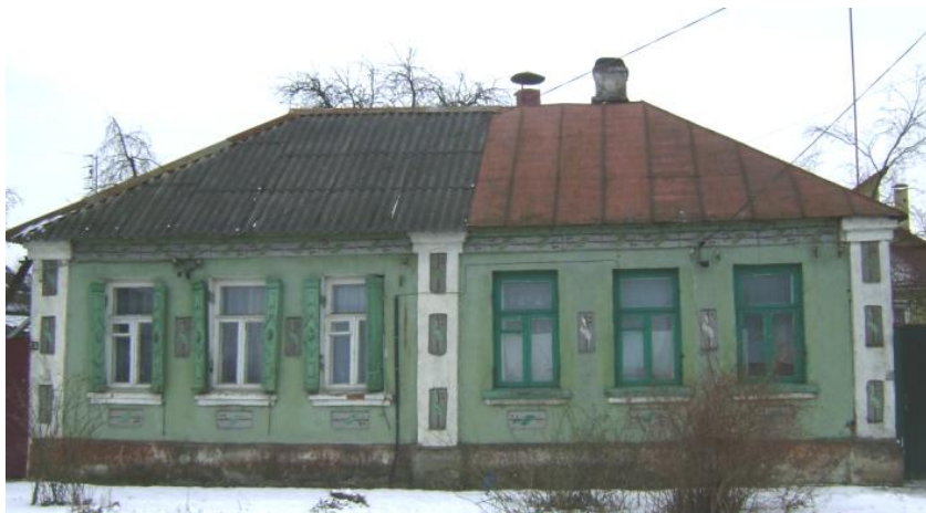
Малюнак 1 – Дом № 56-б на вул. Ф. Дзяржынскага у 2015 г.

На малюнку 1 можна ўбачыць сучасны выгляд дома № 56-б (у 1940-я гады – № 52), а на малюнку 2 – яго ж у 1949 годзе.