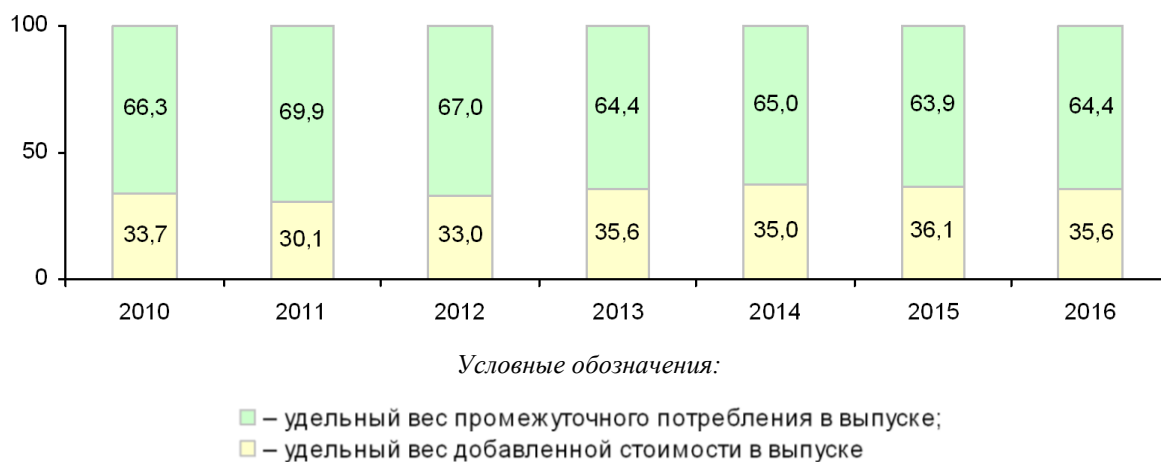
Рисунок 1 – Структура выпуска товаров и услуг по Гомельской области за 2011–2016 годы, %

Структура выпуска товаров и услуг (рисунок 1) характеризуется тем, что устойчивая тенденция снижения удельного веса промежуточного потребления в выпуске, наблюдавшаяся в области в 2011–2014 годах, в 2015 году нарушилась.