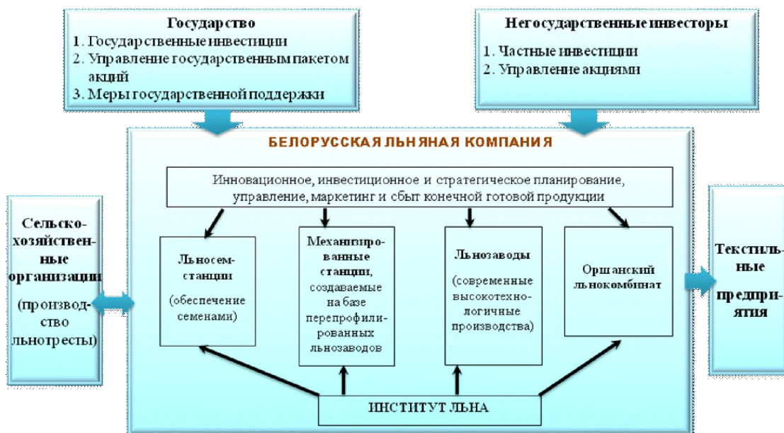
Рисунок 2 – Основные элементы структуры льняного подкомплекса

Проблемы конкурентоспособности и эффективности льняного комплекса республики изучают ученые Национальной академии наук Беларуси под руководством академика В. Гусакова и директора РУП «Институт льна НАН Беларуси» члена-корреспондента И. Голуба. Рассматривается вопрос о создании Белорусской льняной компании. Предполагается, что учредителями создаваемого ОАО выступят государство и административно-территориальные учреждения. Основные элементы структуры льняного подкомплекса в перспективе представлены на рисунке 2. Планируется, что в состав хол-