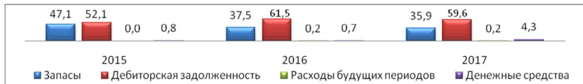
Рисунок 1 – Динамика структуры оборотных средств по их видам за 2015–2017 гг.

Особое значение для оценки рациональности использования оборотных средств имеет детальное изучение их структуры (рисунок 1).