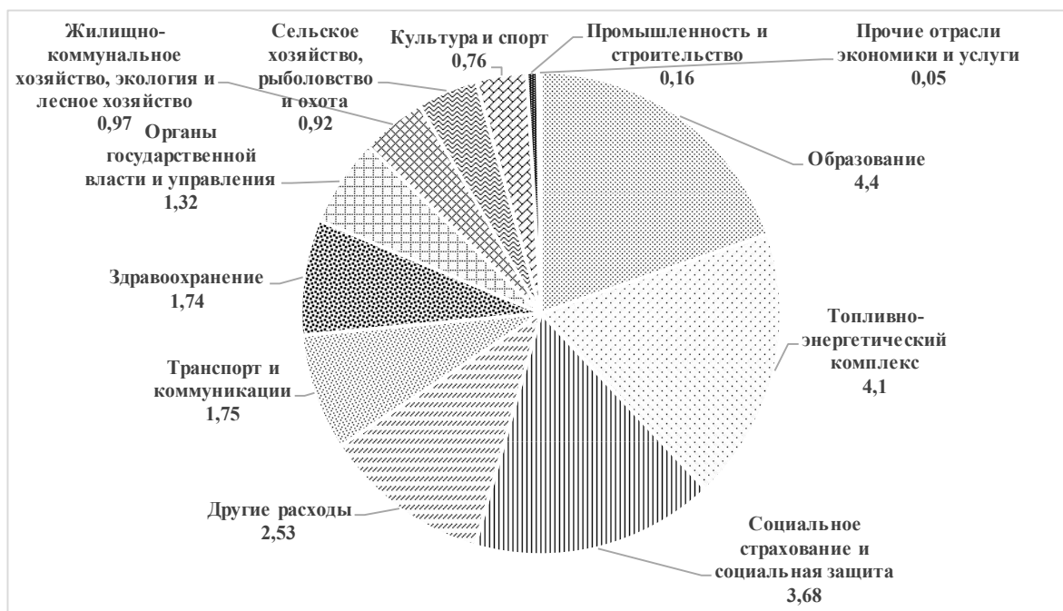
Рисунок 1 – Укрупненная структура расходов государственного бюджета Республики Таджикистан на 2019 г., млрд сомони