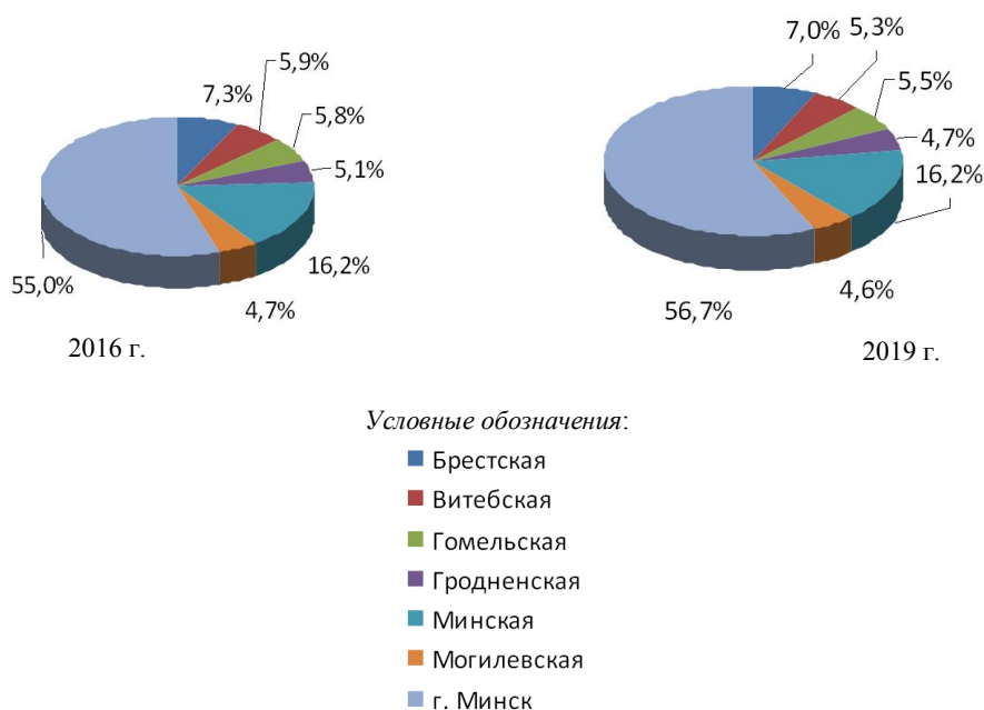
Рисунок 2 – Удельный вес областей и г. Минска в выручке от реализации по субъектам малого и среднего предпринимательства за 2016 г. и 2019 г.

Рассмотрим вклад отдельных областей и г. Минска в формирование выручки от реализации субъектов малого и среднего предпринимательства (рисунок 2).