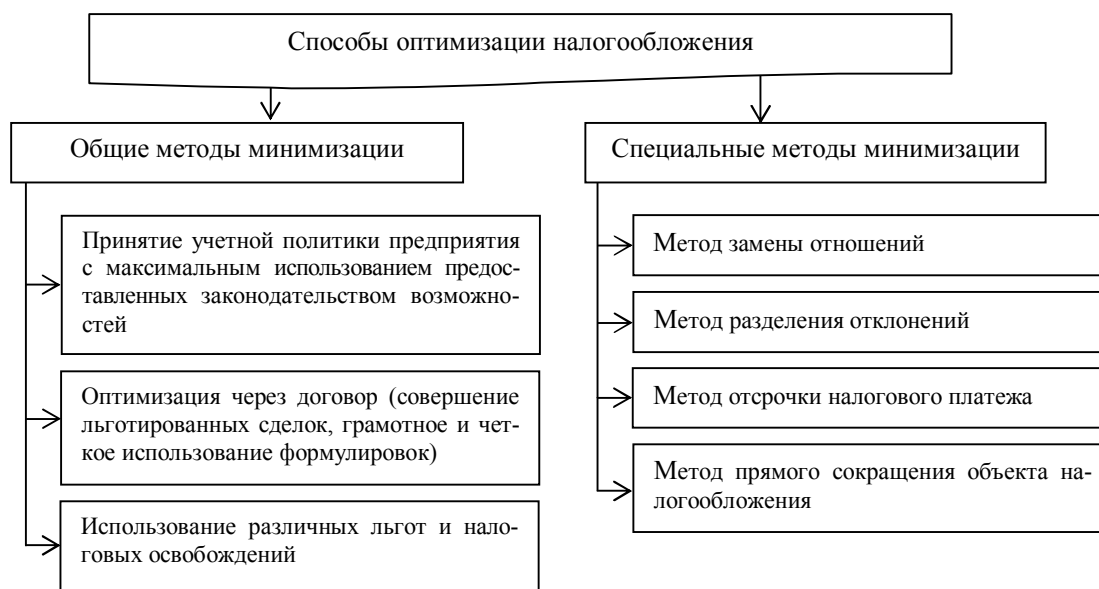
Рисунок 2 – Способы оптимизации налогообложения

Налоговое законодательство предоставляет налогоплательщику достаточно много возможностей для снижения размера налоговых платежей, в связи с чем можно выделить общие и специальные методы минимизации (рисунок 2).