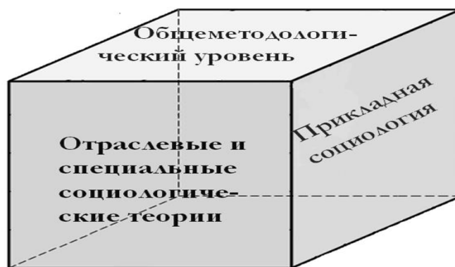
Рисунок 1 – Характеристика структурно-логической системности социологической науки

Термин «социомурлат» образован из двух понятий: «социо» – общество и «мурлат». Последнее понятие позаимствовано из практики возведения домов плотниками, тесавшими дома. Мурлатом называются верхние бревна, которые скрепляют сруб дома. Эти верхние, массивные бревна, балки, на которых лежат латы, делают дом прочным и нерушимым (См. об этом обосновании подробно [2, с. 85-89]).