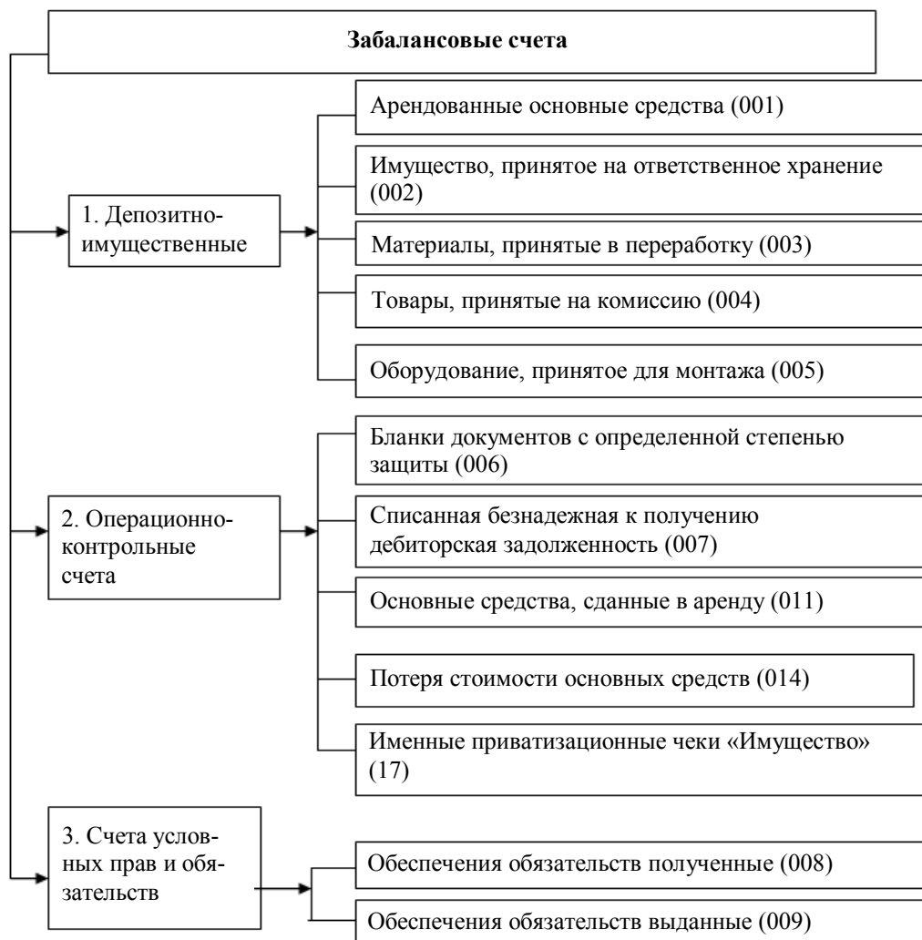
Рисунок 4 – Классификация забалансовых счетов в теории бухгалтерского учета [7]

Если в перечне балансовых счетов разработчики программного обеспечения по бухгалтерскому учету жестко придерживаются установленной основной номенклатуры типового плана счетов, то при построении перечня забалансовых счетов они, в большинстве своем, исходят, прежде всего, из запросов пользователей и возможностей реализации алгоритмов накопления и обработки данных. Такая тенденция отслеживается и при доработке ряда бухгалтерских программ для ведения финансового (бухгалтерского) и налогового учета.