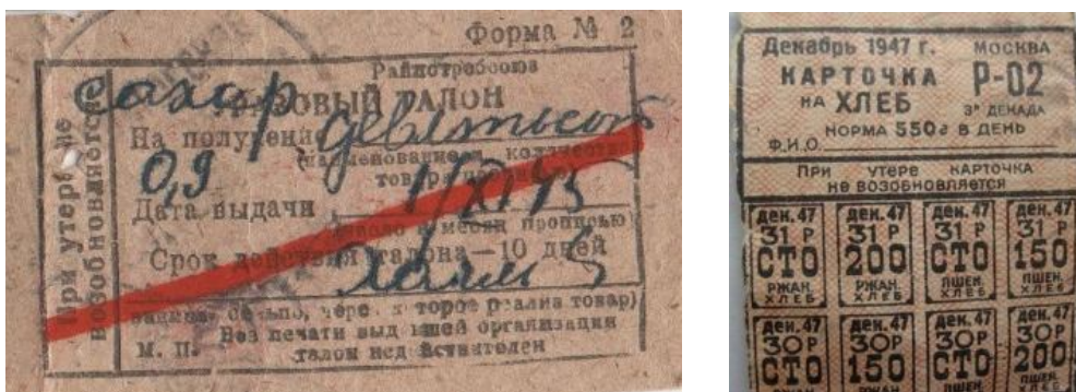
Карточки на сахар и хлеб первых послевоенных лет

Одной из главных целей денежной реформы 1947 года и был вывод из оборота огромных наличных средств, скопившихся у населения в годы войны. Государство объясняло реформу необходимостью защиты интересов народа от разного рода «спекулянтов и дельцов», а также невозможностью перехода к открытой торговле, поскольку излишние деньги в обращении вели к росту рыночных цен, создавали завышенный спрос на товары и возможность для спекуляции.