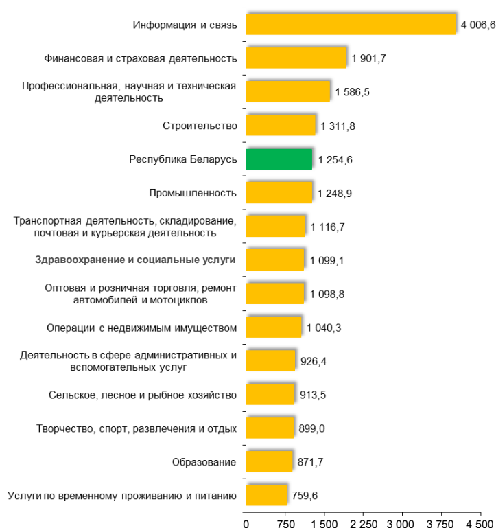
Рисунок 3 – Номинальная начисленная средняя заработная плата работников Республики Беларусь по отдельным видам экономической деятельности в 2020 г.

Следует отметить, что в 2021 г. к наиболее востребованным профессиям на рынке труда относятся логисты, прядильщики, плотники, повара. Относительно новыми вакансиями на рынке труда Беларуси являются маркетологи и работники отдела продаж. Белорусские юристы периодически сталкиваются с проблемами при трудоустройстве, спрос на эту специальность стремительно падает [4]. В Республике Беларусь самые высокие оклады получают работники сферы информации и связи, финансовой и страховой деятельности. Замыкают список сфера образования и сфера услуг по временному проживанию и питанию (рисунок 3).