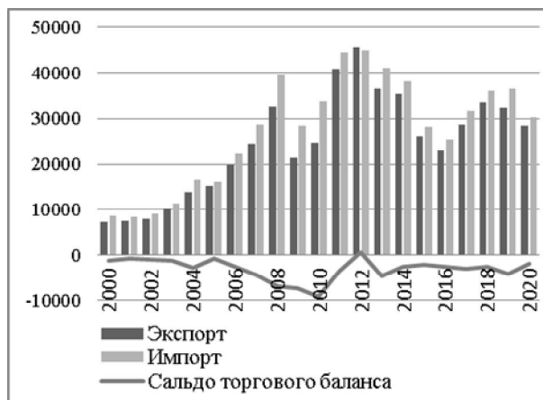
Рисунок 1 – Динамика сальдо торгового баланса, объемов экспорта и импорта товаров Республики Беларусь за 2000–2020 гг., млн долл. США

На основании рисунка 2 можно судить, что сальдо по статье «Услуги» на протяжении всего исследуемого периода носит достаточно устойчивый положительный характер, частично компенсируя отрицательное сальдо по торговле товарами.