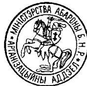
Слева — печать делегации Натившейей рады БНР. Справа — печать Министерства обороны БНР