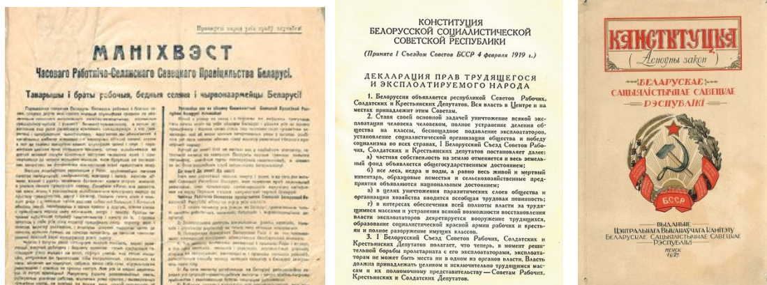
Рисунок 4 – Манифест, Конституция БССР

Альтернативным направлением создания национальной государственности белорусов стало провозглашение 1 января 1919 г. ССРБ. Первоначально по инициативе руководителей Белнацкома и Белорусских секций Российской коммунистической партии (большевиков) планировалось переименовать Западную область, как тогда именовалась территория Беларуси, в Литовско-Белорусскую коммуну либо Автономную республику в составе Российской Советской Федеративной Социалистической Республики (РСФСР). 24 декабря 1918 г. Центральный комитет Российской коммунистической партии (большевиков) во главе с В. И. Лениным принимает решение о целесообразности создания суверенной Белорусской Советской Республики, которая, опираясь на Советскую Россию, защищала бы свободу и независимость белорусского народа и тем самым создала бы препятствие для проникновения империалистических сил на территорию РСФСР. На рисунке 4 представлен Манифест, Конституция БССР.