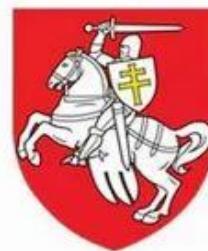
Рисунок 2 – Атрибуты новой государственности