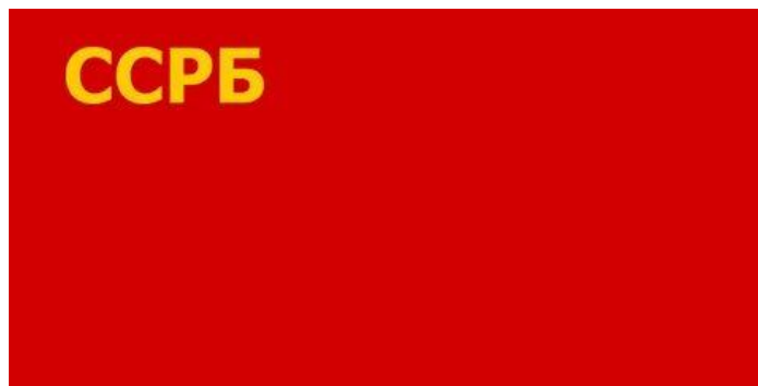
Рисунок 5 – Герб БССР до 1927 г. (рисунок Алоиза Лукши), флаг ССРБ

Герб БССР до 1927 г. в некоторых источниках называют гербом БССР 1919 г. Это более поздний вариант. Герб такого типа появился в Белоруссии не ранее 1922 г., но аббревиатура поначалу выглядела как «ССРБ», затем «БССР». Флаг БССР был описан в ст. 32 Конституции БССР 1919 г.: «Торговый и военный флаг ССРБ состоит из полотнища красного (алого) цвета, в левом углу которого – у древка, наверху помещены золотые буквы ССРБ, или надпись: “Социалистическая Советская Республика Белоруссии”». Изображений этого флага не сохранилось. Некоторые исследователи предполагают, что никакого официального рисунка герба и флага БССР первоначально просто не существовало, так как было не до них. Если герб, который в сущности повторял герб РСФСР, появлялся на печатях, то флага до 1927 г., возможно, не было совсем. Пока в архивах не удалось обнаружить ни одной фотографии или рисунка флага БССР 1920–1927 гг.