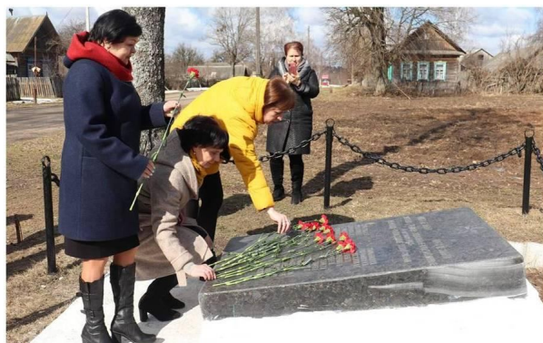
Рисунок 7 – Памятник сожженным деревням в деревне Репище