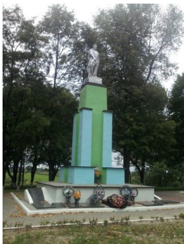
Рисунок 4 – Братская могила на Замковой горе в Чечерске

второй – в декабре 1941 г. Всех евреев и цыган немцы выгнали на улицу, мороз был около 30° С. Людей построили рядами и под конвоем немцев и полицаев погнали за город к противотанковому рву в километре от Чечерска. Он находился на въезде в город со стороны Гомеля. Здесь