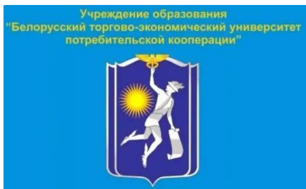
Эмблема Белорусского торгово-экономического университета потребительской кооперации

Успешная многолетняя деятельность университета по подготовке высококвалифицированных кадров для национальной экономики по достоинству оценивалась государством. В 2005, 2014 и 2019 годах БТЭУ награжден Почетными грамотами Совета Министров Республики Беларусь, в 2010 году – Почетной грамотой Национального Собрания Республики Беларусь. По итогам работы за 2014 и 2017 годы университет стал победителем в номинации «Лучшее учреждение высшего образования» г. Гомеля и Гомельской области. В 2017 и 2018 годах БТЭУ признавался лучшим среди учреждений высшего образования Гомельской области по организации идеологической работы в трудовых коллективах. Решением Правления Белкоопсоюза в 2017 году коллективу БТЭУ присужден «Почетный знак» в номинации «За высокие достижения в подготовке кадров». В 2023 году Гомельский горисполком вручил ректору университета благодарственное письмо за высокий профессионализм и плодотворную творческую работу коллектива. Труд преподавателей и сотрудников БТЭУ отмечен многочисленными наградами. Важную роль в истории учреждения образования сыграли участники Великой Отечественной войны и ветераны труда, молодежные объединения, студенческий молодежный клуб.