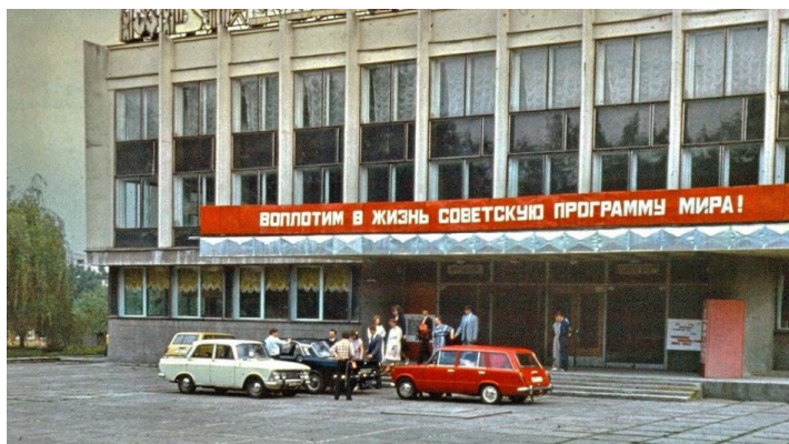
Дворец культуры Гомельского химзавода по Речицкому шоссе, в котором прошло торжественное открытие Гомельского кооперативного института (фото 1970-х годов)