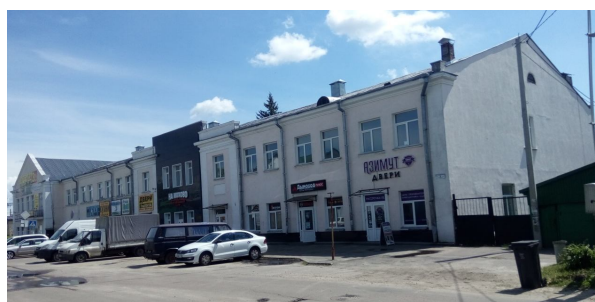
Современный вид здания по ул. Лещинской, 2 в г. Гомеле (фото 2023 года)