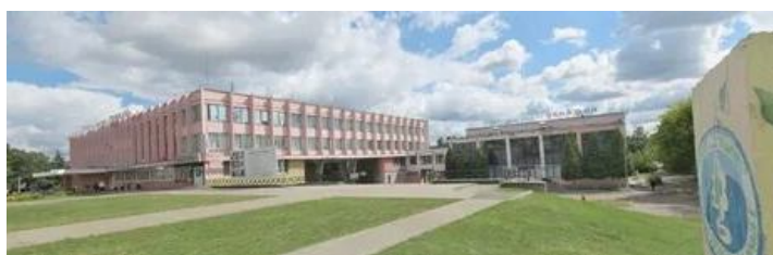
Дворец культуры Гомельского химзавода, переданный на баланс города и переименованный в ДК «Фестивальный» (по названию микрорайона)