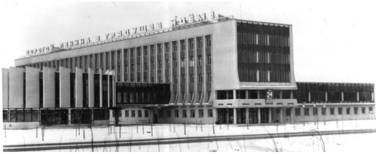
Главный корпус ГКИ в апреле 1980 года

личилось, кафедры были закреплены за двумя созданными дневными факультетами.