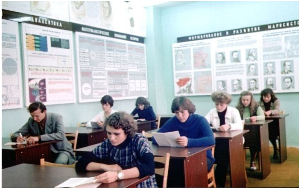
Одна из фотографий с видом учебной аудитории 2-2 ГКИ, сделанная по заказу Центросоюза СССР в 1980 г. для руководства МКА