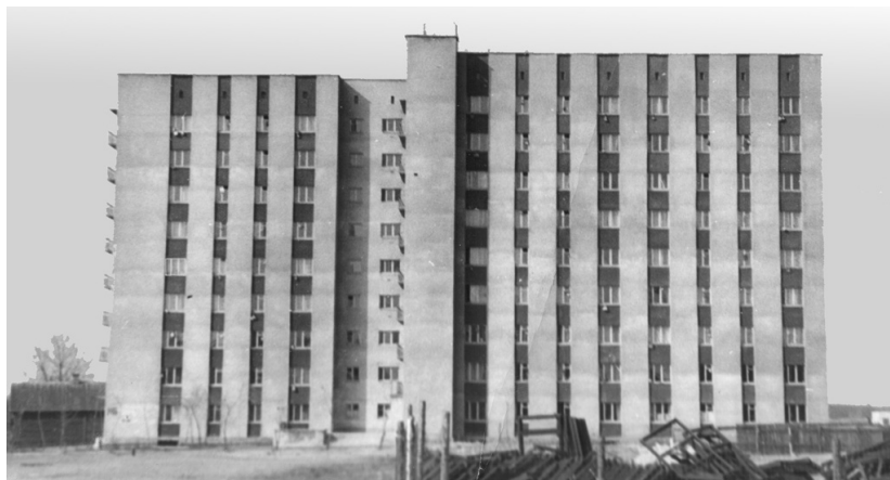
Общежитие Гомельского филиала МКИ по просп. Октября, 48 (фото 1975 года)

Студенты принимали активное участие в строительстве. Были попытки оформить участие комсомольцев-студентов в строительных работах как стройотрядовское движение, однако этому противились подрядные организации, и помощь студентов была в основном безвозмездной. Чаще всего выходили работать группами во главе со старостой. График работы студенческих групп на строительстве объектов будущего самостоятельного вуза составлялся и контролировался деканатом.