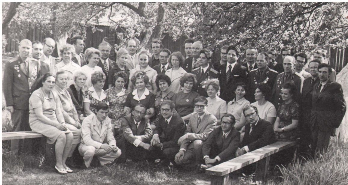
Преподаватели и сотрудники ГФ МКИ во внутреннем дворе учебного корпуса по ул. Лещинской, 2 в День Победы 9 мая 1975 года