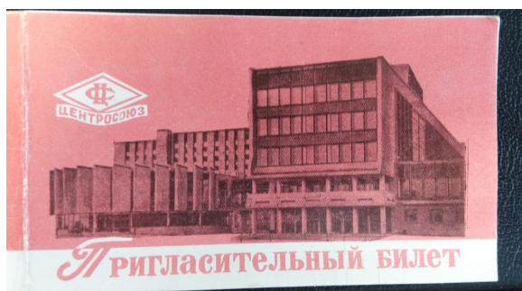
Пригласительный билет на открытие ГКИ

К торжествам, связанным с открытием института, было решено изготовить приглашения и памятные знаки. Был объявлен конкурс на лучший их эскиз, в котором участвовали преподаватели, сотрудники и студенты. Ко времени открытия ГКИ были изготовлены значки, оборудованы стенды, фотовитрины, праздничные стенгазеты.