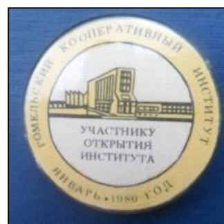
Памятные значки участникам открытия Гомельского кооперативного института Центросоюза СССР (январь 1980 года, г. Гомель)

Торжественное открытие ГКИ состоялось во Дворце культуры Гомельского химического завода, одного из градообразующих предприятий Гомеля, входившего в число крупнейших заводов химической промышленности Советского Союза. Дворец культуры был расположен недалеко от главного здания ГКИ в Советском районе Гомеля.