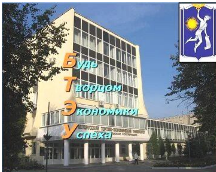
Будь Творцом Экономики Успеха! Девиз университета отражает приоритеты национально-государственной политики современной Республики Беларусь

БТЭУ стал инициатором создания Сетевого университета «Кооперация», объединяющего образовательный, научный и творческий потенциал девяти кооперативных учреждений высшего образования из шести стран постсоветского пространства, что положительно отразилось на конкурентоспособности университета на международном рынке образовательных услуг. Сегодня международные связи БТЭУ продолжают расширяться, обретают новые формы сотрудничества и взаимодействия. В университете обучаются не только граждане постсоветских республик, но и студенты дальнего зарубежья, в том числе из ряда стран Азии и Африки.