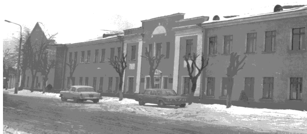
Здание по ул. Лещинской, 2 в г. Гомеле, с которым связаны начало становления будущего университета (фото конца 1970-х годов)