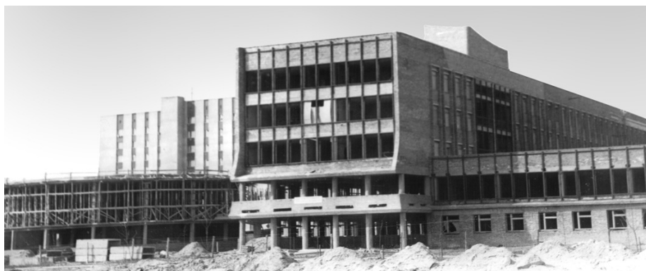
Главный корпус будущего ГКИ в период завершения строительных работ (фото 1978 года)