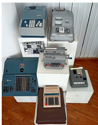
Так выглядели первые технические средства обучения и вычислительная техника ГКИ в 1970 – нач. 1980-х годов