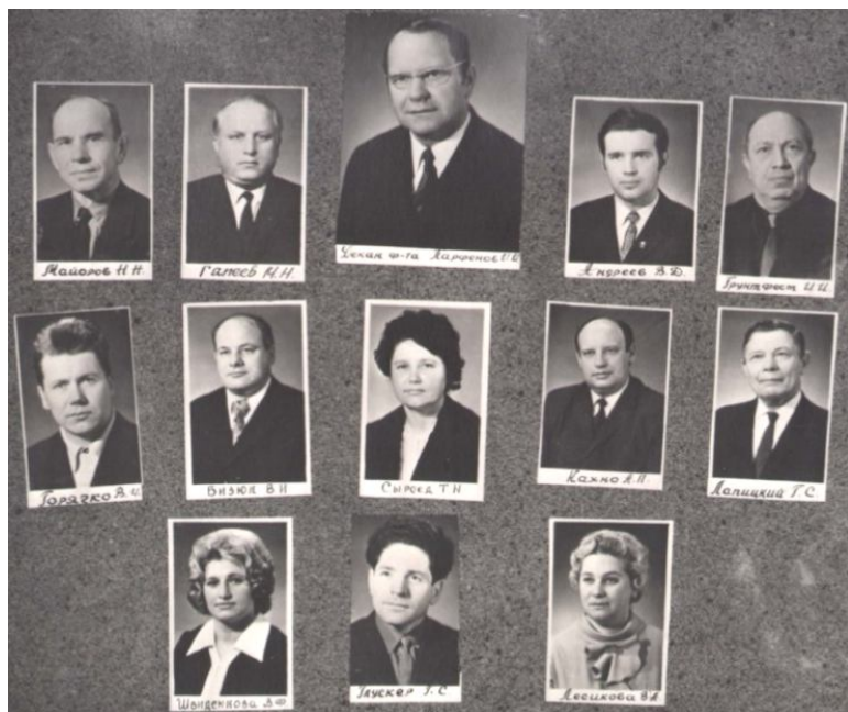
Старейшие преподаватели и сотрудники Гомельского факультета МКИ

Новый этап истории будущего института и университета связан с принятием решения об открытии на базе Гомельского заочного факультета МКИ дневного отделения. В сентябре 1973 года к занятиям в здании на Лещинской, 2 приступил 61 студент-бухгалтер. Предшествовало этому важному событию совместное постановление ЦК КПБ, Совета Министров БССР и Правления Центросоюза от 22 октября 1970 года «О мерах по улучшению кооперативной торговли в республике», в котором было проанализировано положение с кооперативными кадрами в БССР и поставлена задача расширения подготовки специалистов высшей квалификации для Белкоопсоюза с перспективой открытия в Гомеле на базе уже действовавшего факультета нового филиала МКИ [1]. Несколько ранее, 4 августа 1967 года, на бюро ЦК КПБ был рассмотрен вопрос «Об открытии в г. Гомеле института кооперативной торговли» и принято решение «согласиться с предложением