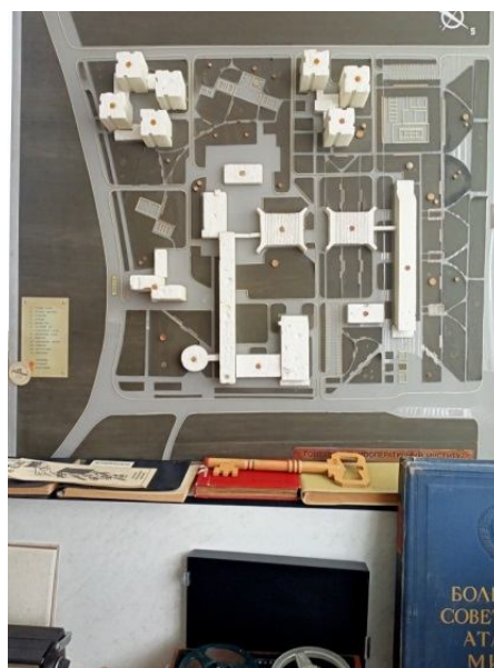
Макет студгородка Гомельского кооперативного института в границах между Речицким шоссе, проспектом Октября, Студенческим проездом и ул. Студенческой в Советском районе Гомеля