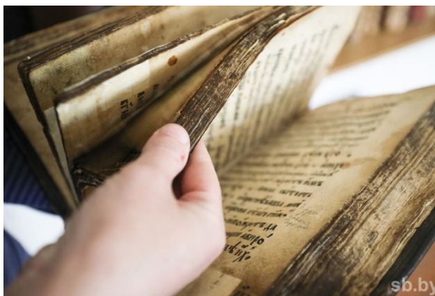
Рисунок 3 – Лавришевское евангелие (факсимильное издание)

Религиозная роль Лавришевского монастыря всегда выходила за рамки функции просто места для богослужений. На протяжении столетий он был духовным центром, культурным скрипторием, при котором действовала библиотека, велась переписка книг, создавались иконы, хранилась церковнославянская письменная традиция, символом преемственности. Даже в эпоху закрытия в советский период (монастырь был упразднен в 1960-х гг.) память о нем сохранялась среди верующих как часть утраченного духовного наследия. Его возрождение в конце XX в. стало одним из знаковых событий в процессе восстановления православной жизни в независимой Беларуси (рисунок 4).