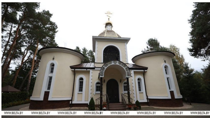
Рисунок 4 – Современный вид Свято-Лавришевского монастыря

Религиозная роль Лавришевского монастыря всегда выходила за рамки функции просто места для богослужений. На протяжении столетий он был духовным центром, культурным скрипторием, при котором действовала библиотека, велась переписка книг, создавались иконы, хранилась церковнославянская письменная традиция, символом преемственности. Даже в эпоху закрытия в советский период (монастырь был упразднен в 1960-х гг.) память о нем сохранялась среди верующих как часть утраченного духовного наследия. Его возрождение в конце XX в. стало одним из знаковых событий в процессе восстановления православной жизни в независимой Беларуси (рисунок 4).